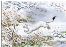
7. В. Горбатов «Горноста́й»

Натюрморт Анималистический жанр Портрет Батальный жанр Исторический жанр Бытовой жанр Пейзаж