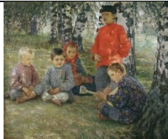
5. Н. Богданов-Бельский «Виртуоз»