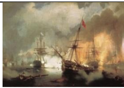
1. И. Айвазовский «Морское сражение при Наварине»