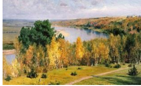
2. В. Поленов «Золотая осень»