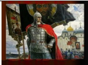
3. Ю. Пантюхин «Александр Невский»