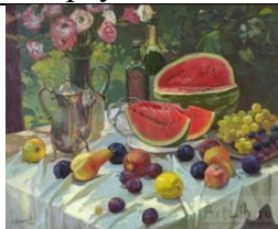
6. А. Левченков «Август»