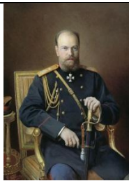
4. И. Куликов. Портрет Александра III